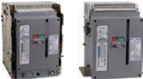
NA1-2000 400A ...2000A