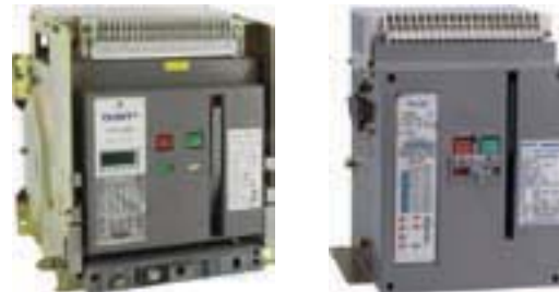
NA1-3200, 4000 2000A ...4000A