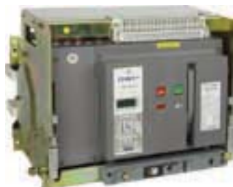
NA1-6300 4000A ...6300A